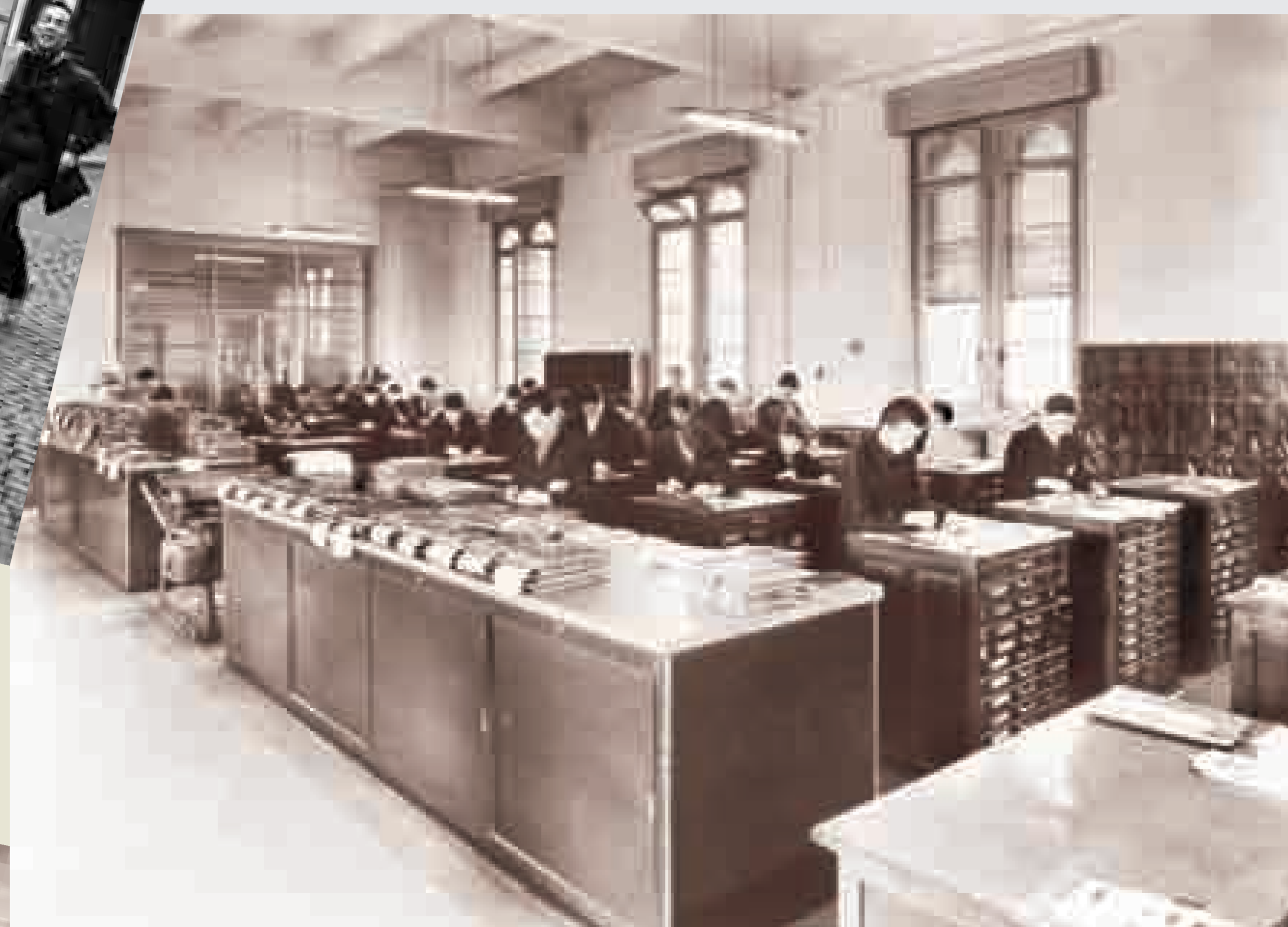
Foto storiche (1936) dei laboratori di grafica, falegnameria, calzoleria, sartoria, legatoria