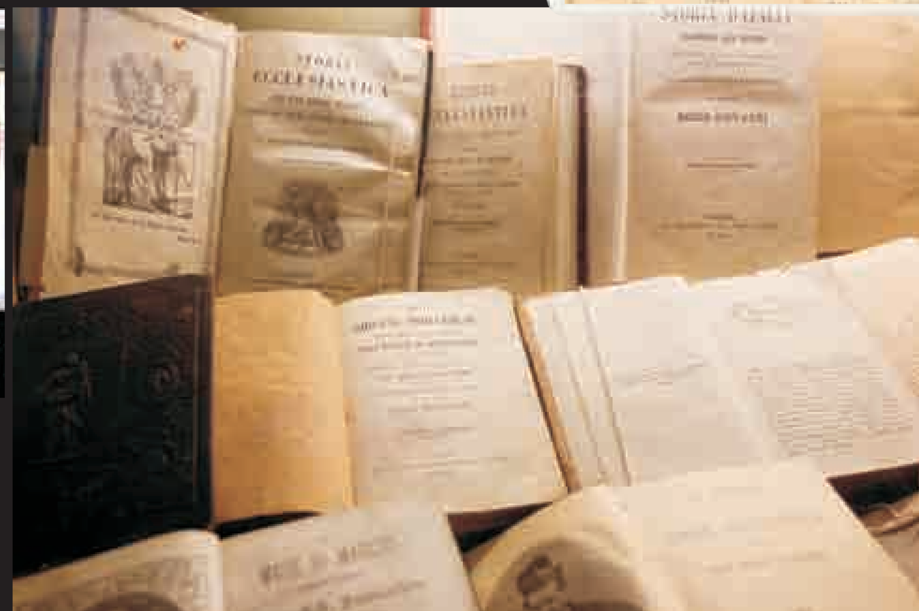
Alcuni libri scritti da don Bosco