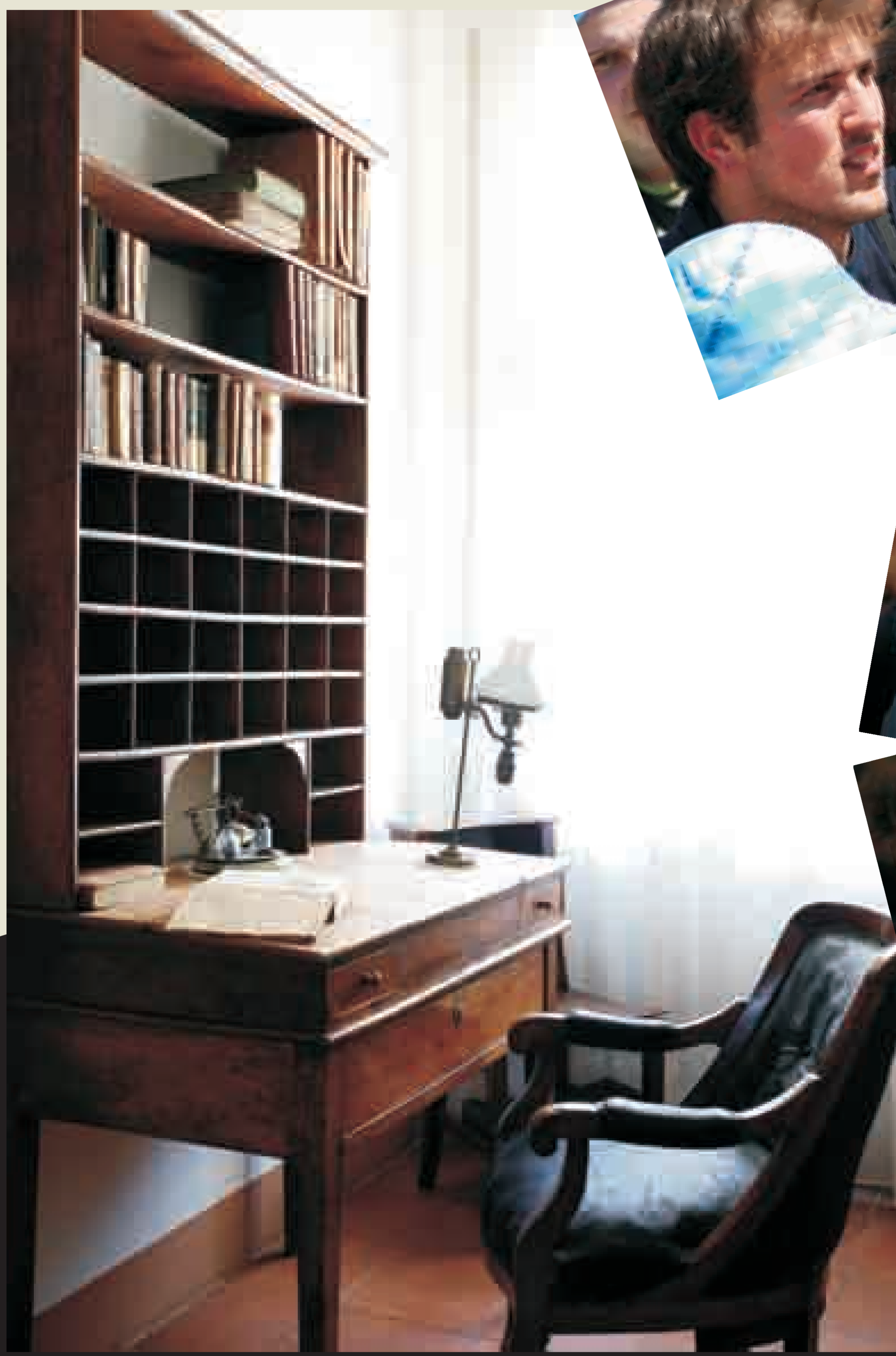
Scrittoio nell'ufficio del Santo a Valdocco