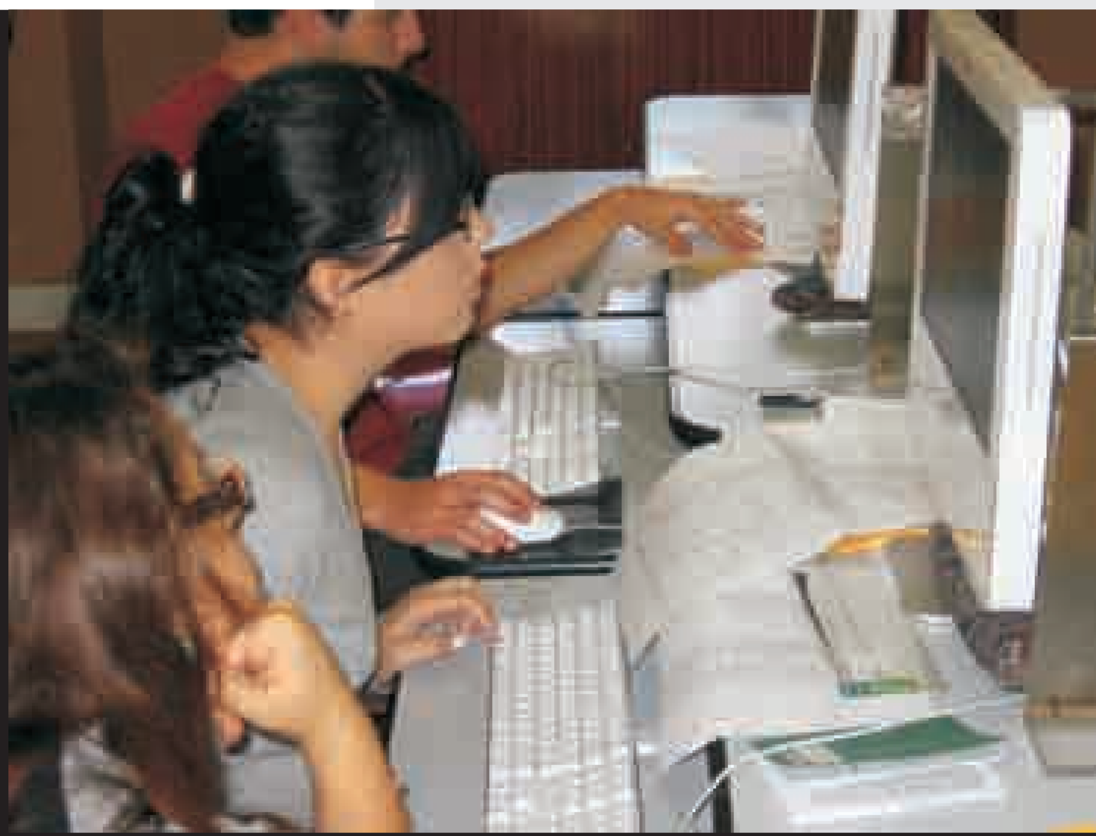
Alcune istantanee di laboratori di grafica e meccanica