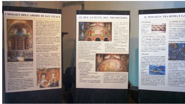
Esempi di allestimento