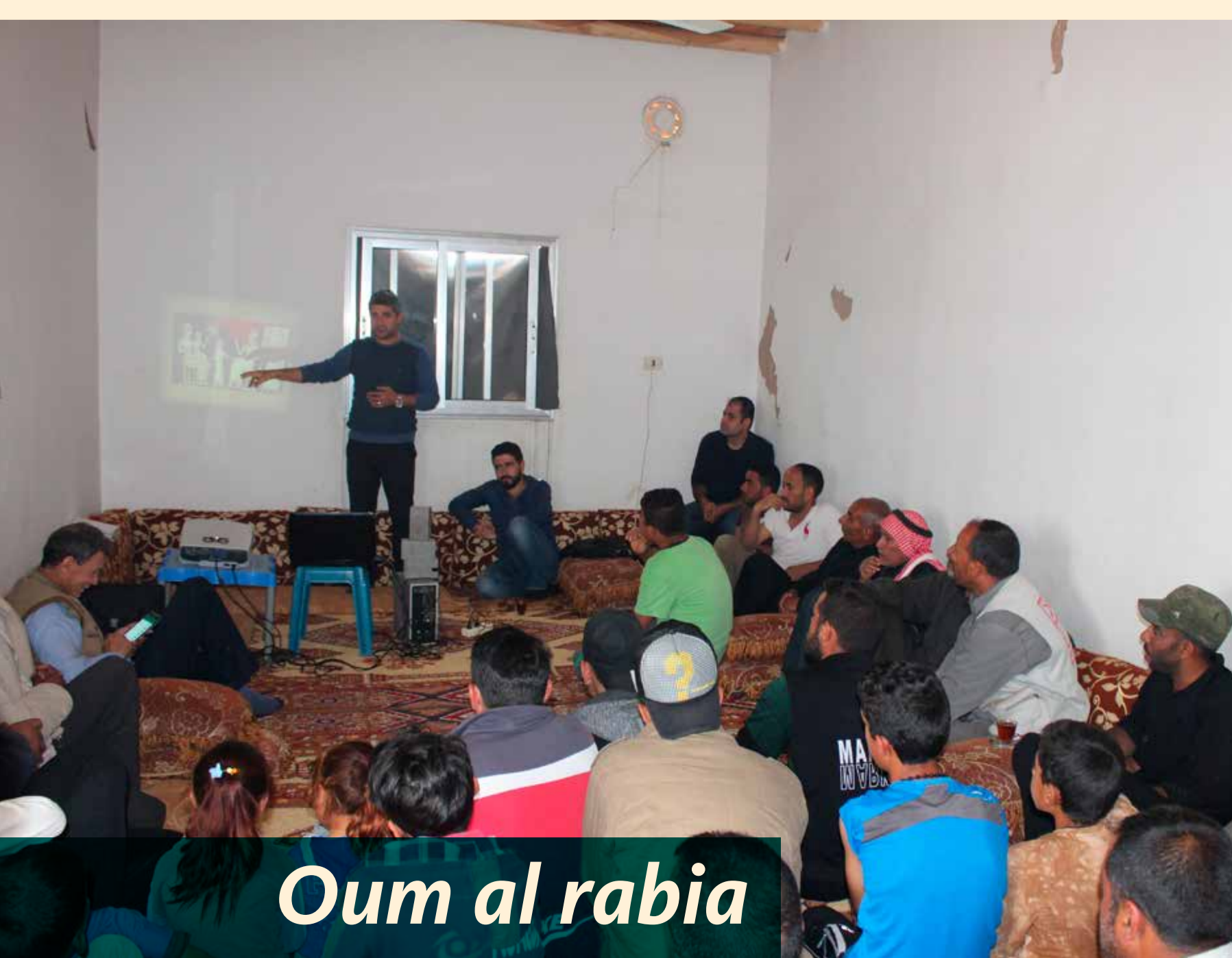
Oum al rabia