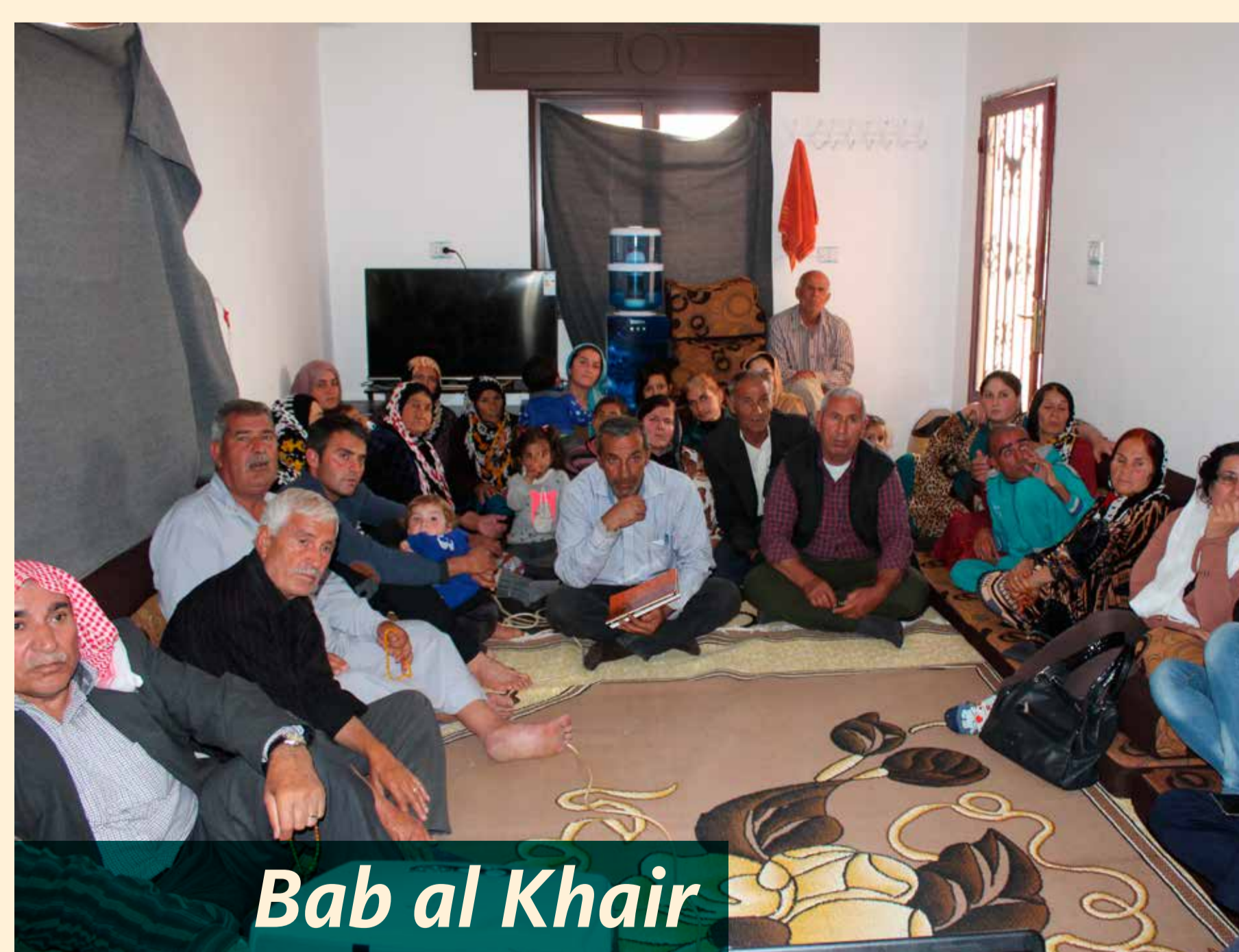
Bab al Khair