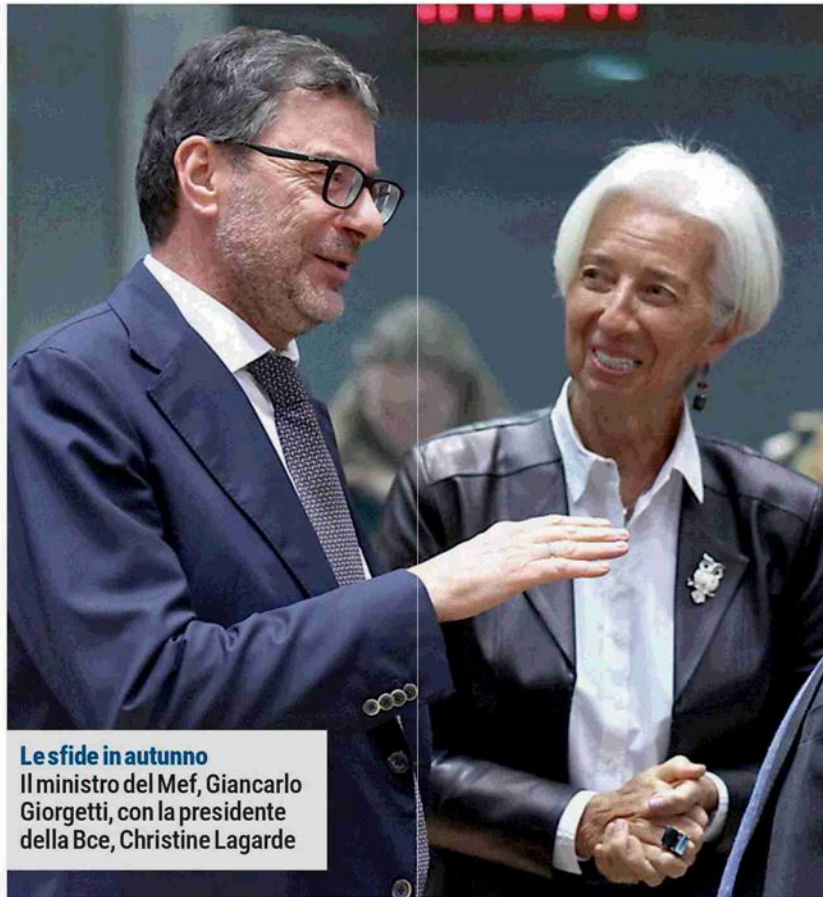
Le sfide in autunno Il ministro del Mef, Giancarlo Giorgetti, con la presidente della Bce, Christine Lagarde