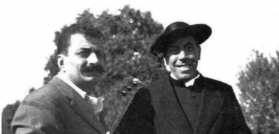
Giovannino Guareschi e Fernandel sul set di "Don Camillo" nel 1952

Oggi al Meeting di Rimini torna Guareschi, in un incontro di testimonianze e letture guareschiane: "Il Cristo della via Emilia"