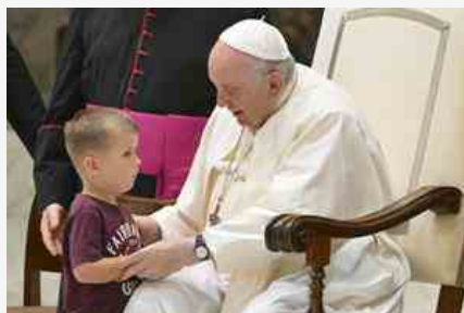
L'Udienza Il Papa: l'alleanza dei vecchi e dei bambini salverà